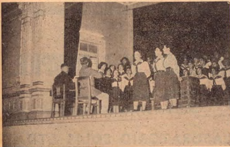
Aspecto de la presentación del "Coro de la Escuela Secundaria" en la Sala Magna de la Escuela Normal en Heredia.